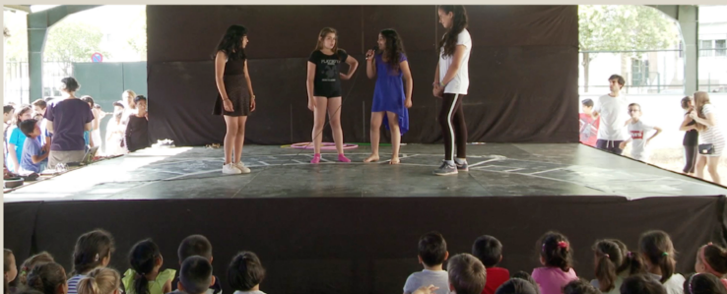
Concierto de remezclas